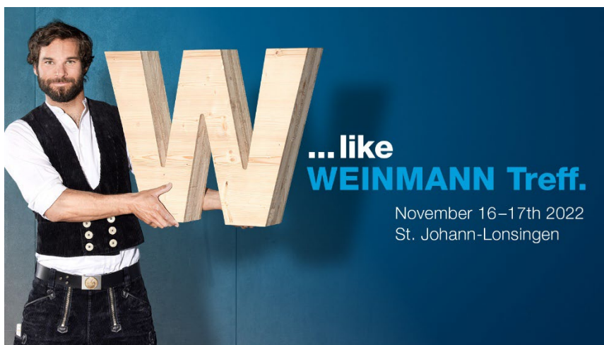
Photo 1 : W comme WEINMANN Treff : le rendez-vous interprofessionnel autour de la construction bois.

Ces concepts d'installations seront présentés lors du salon WEINMANN Treff et il sera également possible d'avoir des entretiens de conseil personnalisés. En outre, des démonstrations en direct des machines seront organisées.